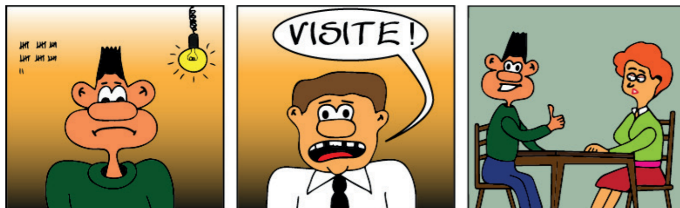
Caricature réalisée par JP, détenu à la prison de Schrassig